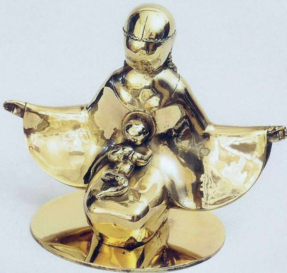
Virgo - polished brass - 28 cm - 1929 Virgem - bronze polido - 28 cm - 1929