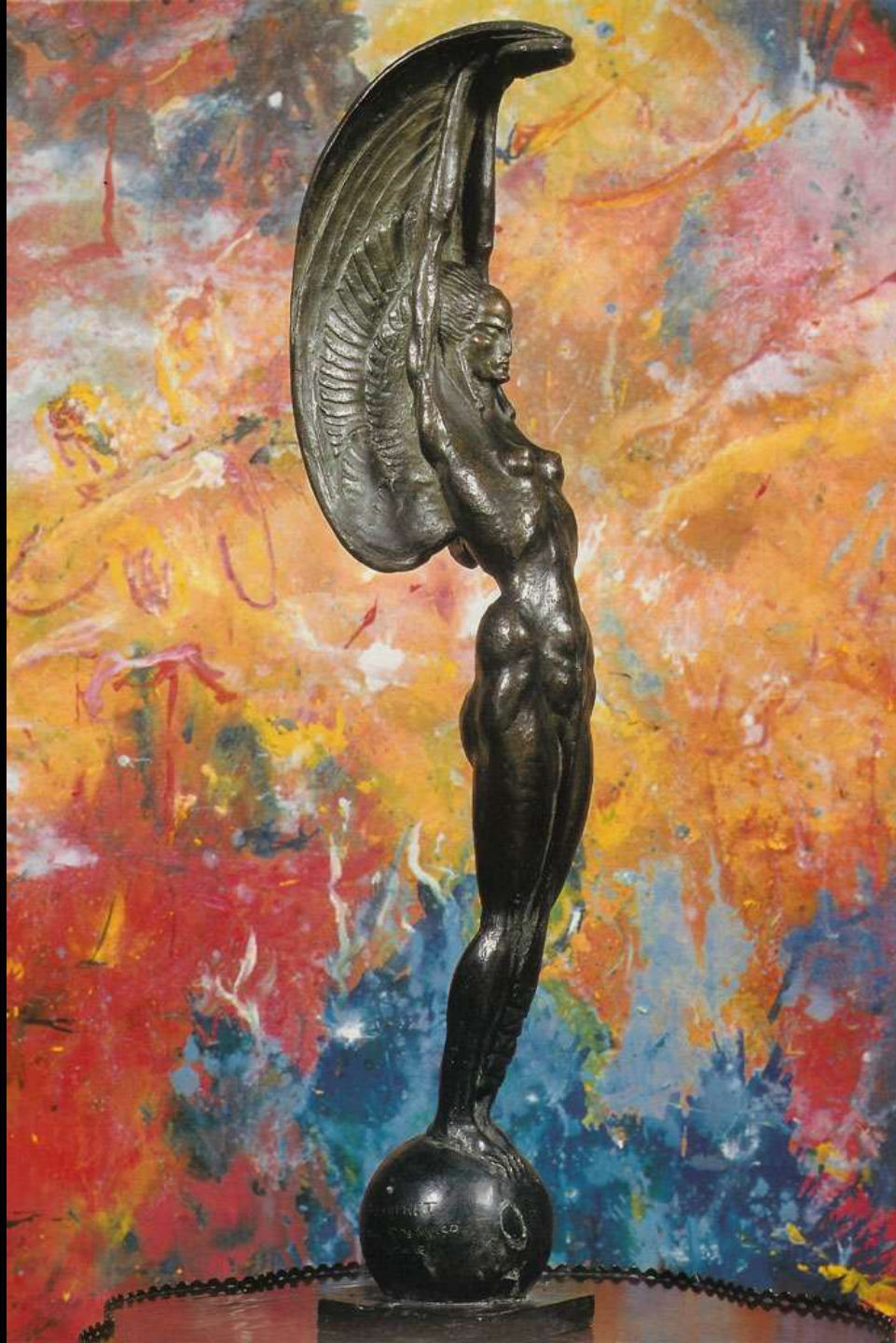
Victory - bronze - 70 cm - 1922 Vitória - bronze - 70 cm - 1922