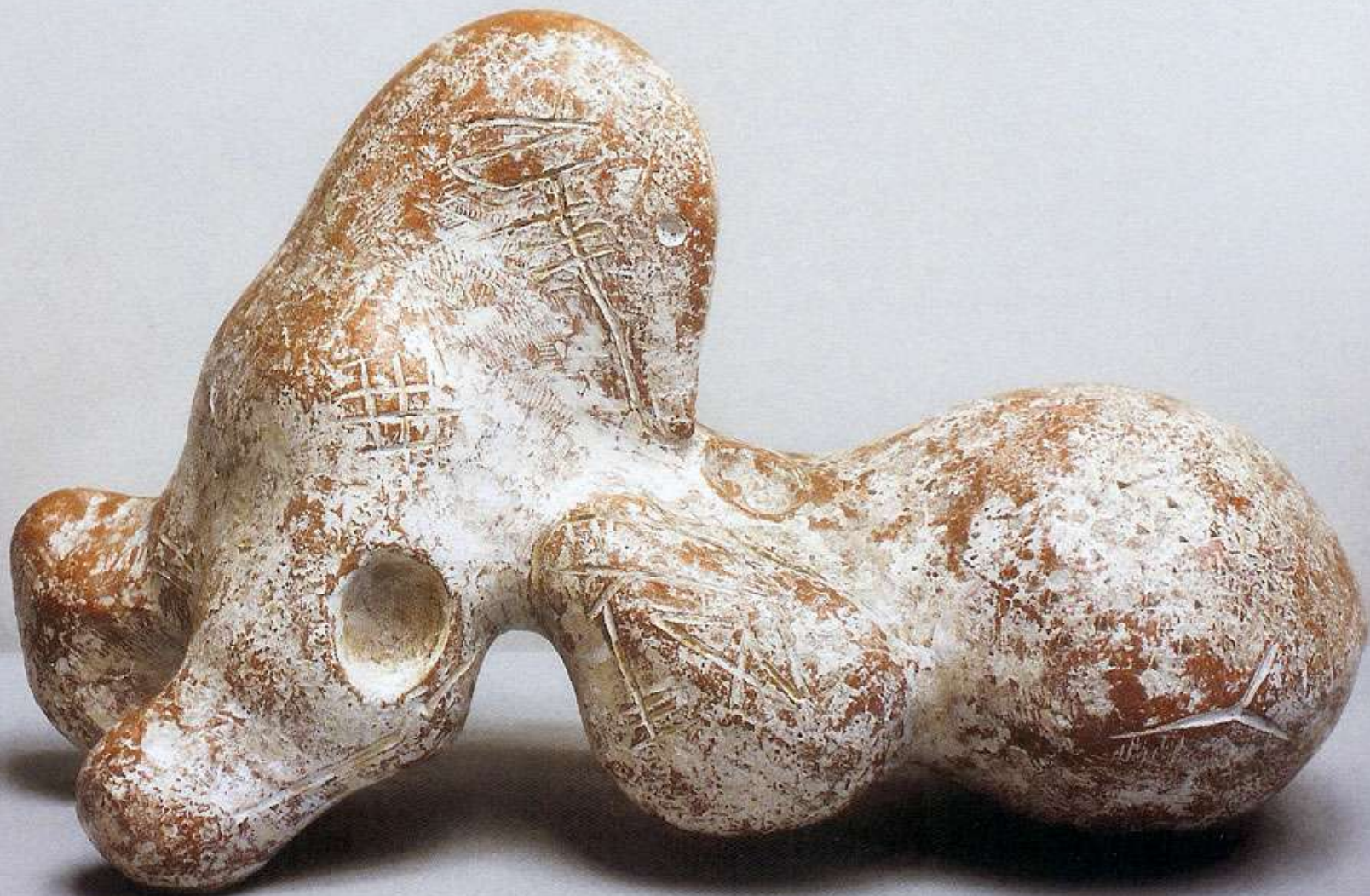
Marajoara Drama - terracotta - Dec. 50 Drama Marajoara - terracota - Dec. 50