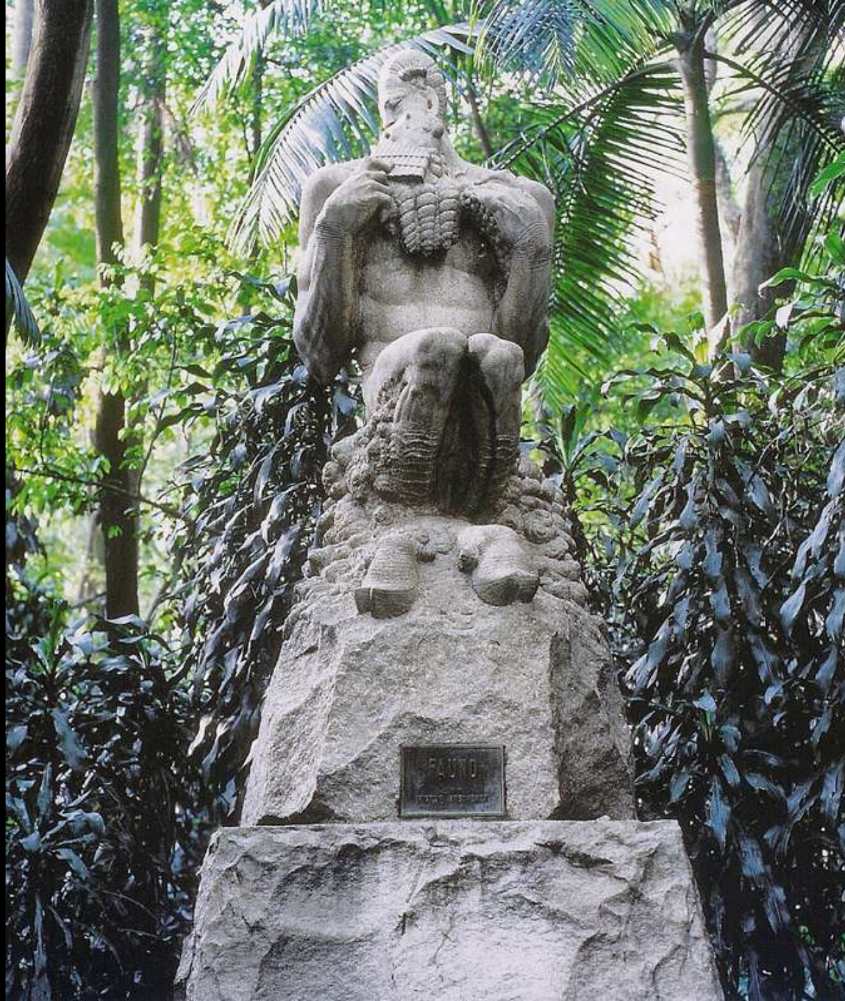
Faun - Granite - 344 x 170 cm - Dec. 40 Fauno - Granito - 344 x 170 cm - Dec. 40