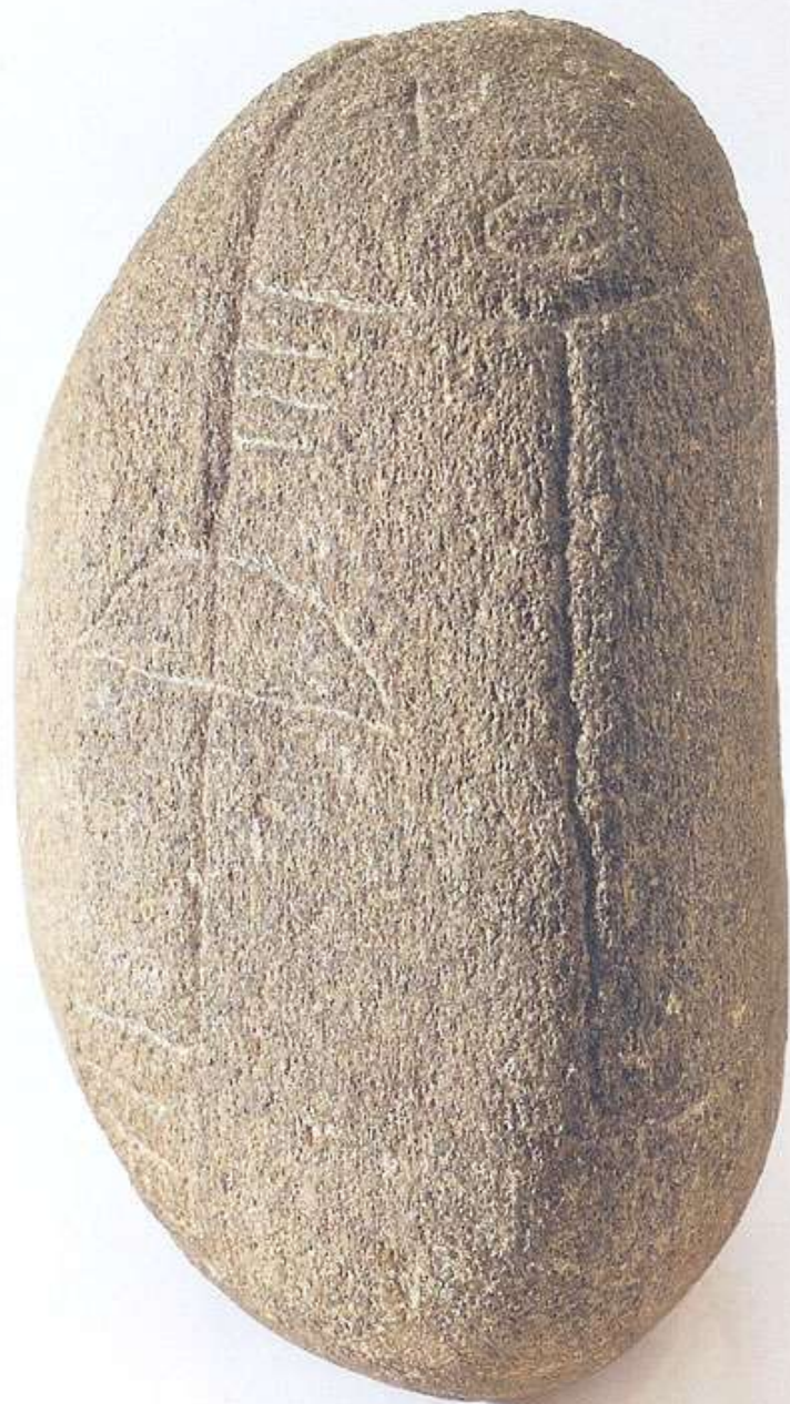
Acropi Indian - stone- 30 cm - 1947 Índia Acropi- pedra - 30 cm - 1947