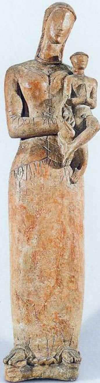
Maternity - terracotta - 80 cm - 1952 Maternidade - terracota - 80 cm - 1952