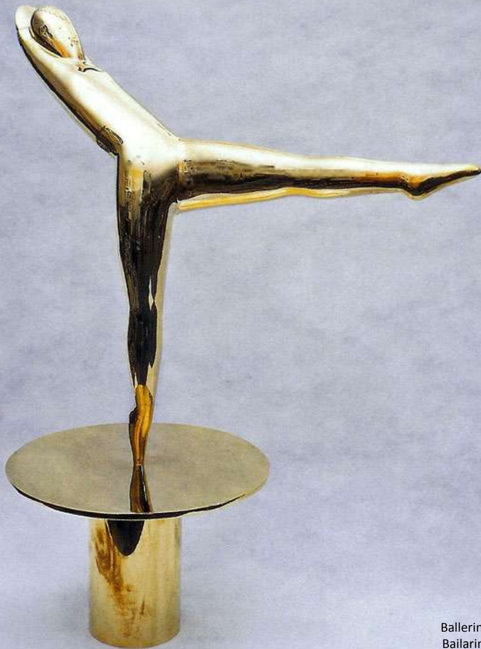
Ballerina - polished brass - 70 cm - 1928 Bailarina - bronze polido - 70 cm - 1928