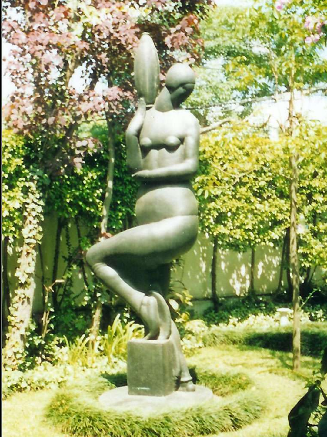
Carrier Perfume - bronze - 331x174 cm - 1923 Portadora de Perfume – bronze - 331x174 cm - 1923