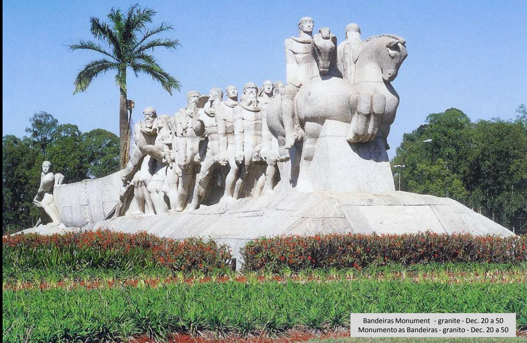
Bandeiras Monument - granite - Dec. 20 a 50 Monumento as Bandeiras - granito - Dec. 20 a 50