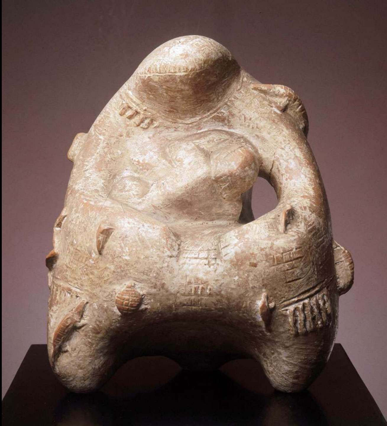
Mother - 28 cm - terracotta - 1951 Mãe - 28 cm - terracota - 1951