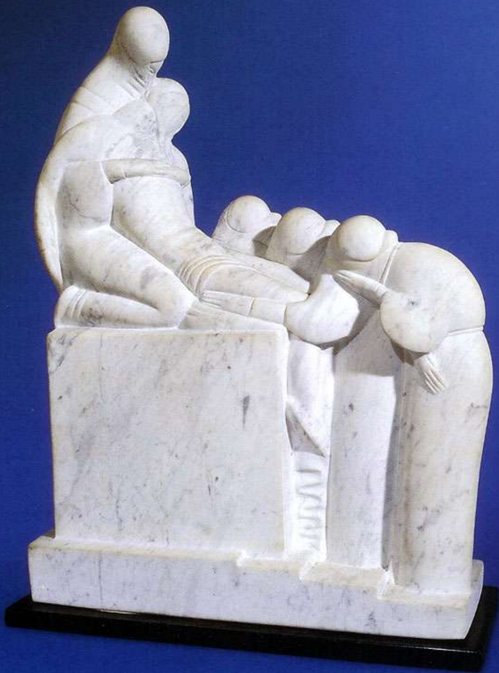
Entombment - marble - 52 cm - 1923 Sepultamento - mármore - 52 cm 1923