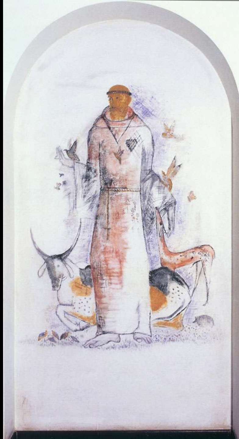
Fresco S. Francis - crayon - Dec. 50 Afresco São Francisco - crayon - Dec. 50