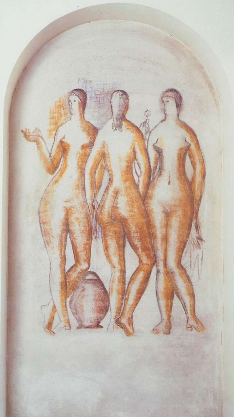
Three Graces - fresco - 1952 Três Graças - afresco - 1952