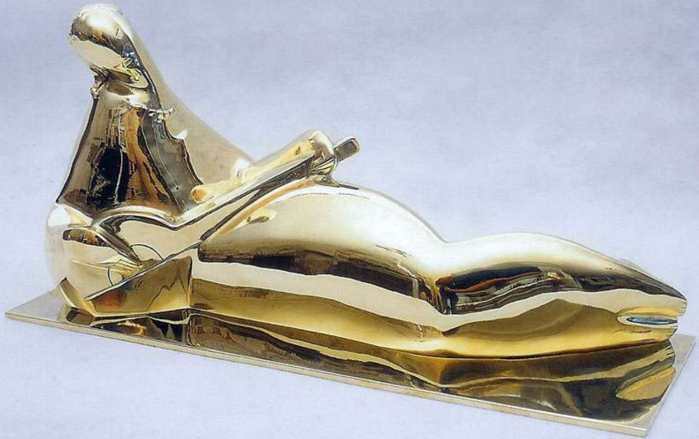
Guitarist - polished brass - 70 cm - 1928 Guitarrista-bronze polido - 70 cm - 1928